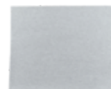
Brusný papír 3M