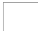
Schleifvlies 150x230 mm